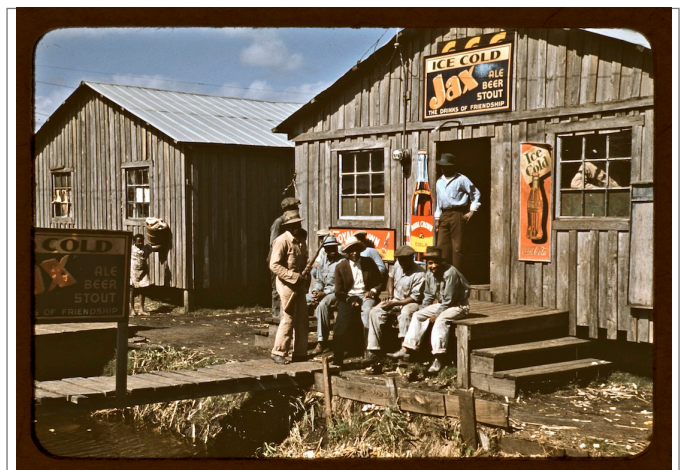
Juke joint i Florida, 1944

♪ Robert Johnson: Sweet Home Chicago (23/11 1936)/Son House: Levee Camp Blues (ca. 1960)