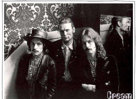
Cream: Jack Bruce, Ginger Baker, Eric Clapton

♪ Fleetwood Mac: Black Magic Woman (1968)