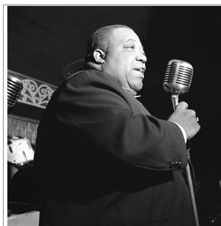
Bluesshouter: Jimmy Rushing, 1946